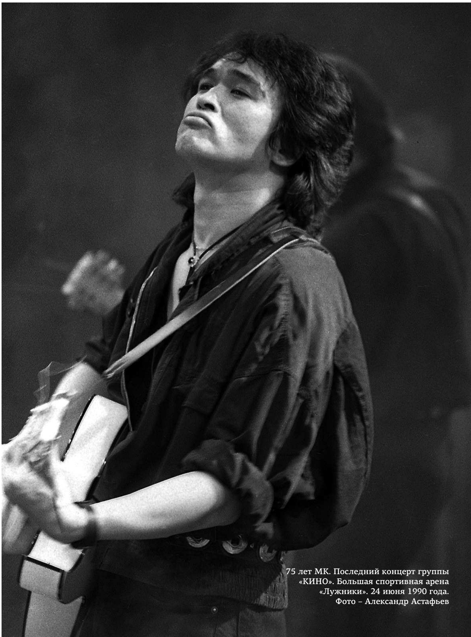
75 лет МК. Последний концерт группы «КИНО». Большая спортивная арена «Лужники». 24 июня 1990 года.