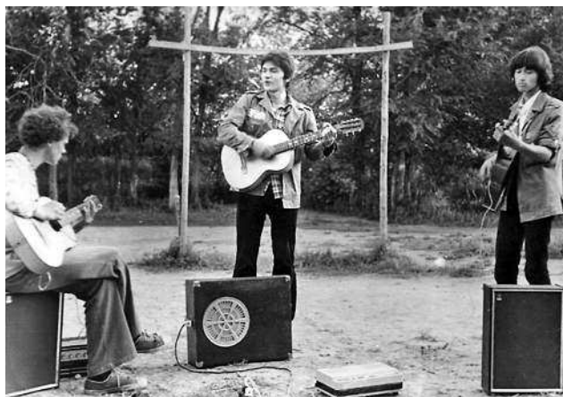
Репетиция «Палаты № 6».