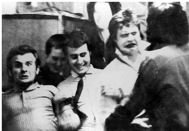
Тусовка со Свином.

Как-то мы с Цоем шли на место сбора компании. Пока шли, Цой нашелдохлую утку и стал тащить ее за лапу, хотел пораздовать «Свинью». Она была еще не тухлая, но так... запах уже шел. Когда проходили мимо трамвайного кольца со зданием для диспетчеров, выскочили пять водителей, сказали нам: «Все, ребята, идите к нам, вы убили утку, сейчас мы милицию вызовем». Мы с Цоем с радостью пошли, естественно... Эти начали звонить в милицию, но та отказалась ехать из-задохлой утки... К тому же в здании, куда нас привели, из-за запаха стало ясно, что утка абсолютно несвежая... И когда нас спросили: «А где вы ее взяли?» – мы ответили, что «убили ее дней пять назад и вот все ходим с ней, не знаем, куда ее деть...».