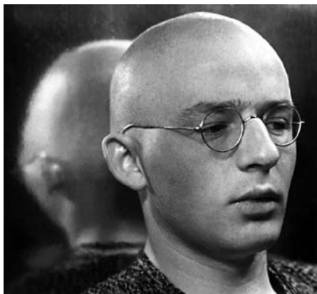
Иоханнес Иттен (1888–1967), швейцарский художник-авангардист, крупнейший исследователь цвета в искусстве и педагог, создавший учебный курс для знаменитой Школы строительства и художественного конструирования «Баухауз»